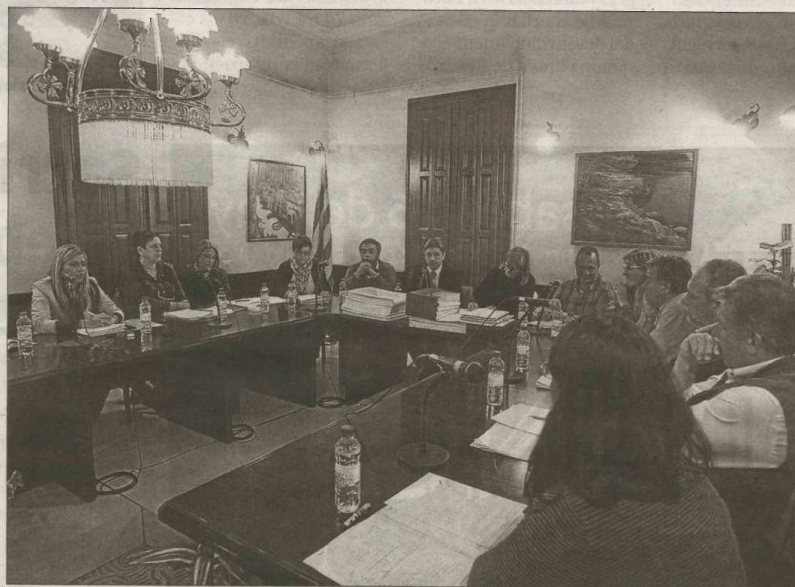
El ple de l'Ajuntament de Caldes de Malavella, en una imatge d'arxiu. CiU i PSC formen, amb sis regidors, l'equip de govern. La resta de grups sumen set regidors.