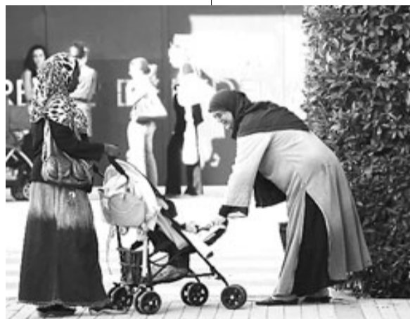
Immigrants, en un barri de Girona.