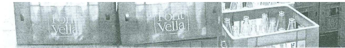
La planta de Font Vella, a Sant Hilari Sacalm, en plena activitat ahir a la tarda.

En un estiu normal els màxims de consum d'aigües envasades s'estenia durant la segona quinzena