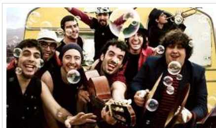
Els vuit integrants de Txarango

"De més joves, agafàvem la guitarra i fèiem autoestop fins als pobles de la Costa Brava"