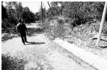
Els veïns critiquen que es prioritzeïn les obres d'aquest carrer. marc martí

Els propietaris van voler deixar clar que ells no s'han oposat mai a la millora d'aquest tram de carretera, i van afirmar que haguessin acceptat fer-ho un cop les obres de la urbanització s'haguessin finalitzat i amb una altra partida pressupostària. "Nosaltres en cap moment hem dit que això no s'asfaltés. El que vam dir és que s'acabés el que hi havia dins del projecte, i que si el pressupost donava per fer aquesta obra, que s'aprofités, i sinó, que lluitaríem perquè es pogués fer", afirmava un veí. La seva queixa, però, és que en ple procés dels treballs, es va prioritzar aquesta actuació sense que ni tan sols estés prevista, i sense que Tossa en sapigués res (tenen una resposta del consistori afirmant que no en tenia constància).