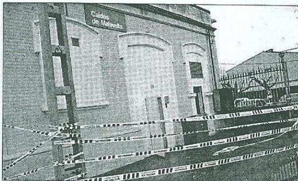
TANCADA. Diverses parts de l'estació van quedar precintades.

de la companyia a regular els trens de manera manual.