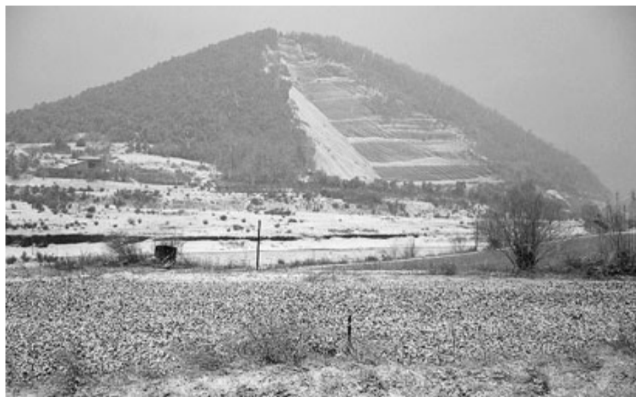
Aspecte del volcà Croscat, a Santa Pau, ahir a la tarda.

A la Garrotxa, a partir del migdia, va nevar al vessant occidental. Al vespre, la neu havia agafat a bona part del terme de Santa Pau i al veïnat de Batet (terme d'Olot). Al nucli de la capital, als barris més alts, com ara Bonavista, s'havia de circular amb precaució. L'Ajuntament tenia previst passar-hi la pala a la nit. També es va veure força afectat el municipi de Vall de Bianya, fins i tot a les parts baixes.