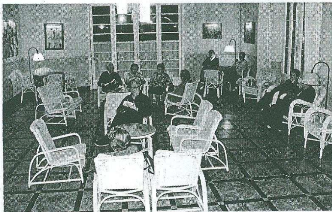
Clients del Prats, ahir a la tarda, esperant per fer la revisió mèdica.

És d'un plet que ha durat gairebé vint anys, el Tribunal Suprem va dictaminar el gener del 2005 que Malavella no podia exercir el seu dret de retracte per adquirir el Prats però sí que podia deixar de subministrar aigua. «S'ha anat ajornant l'execució de la sentència i s'ha intentat arribar a un acord basat en una nova relació comercial que fos satisfactò-