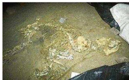
Una imatge de les restes fossilitzades del tapir localitzat l'any passat a Caldes. carles colomer

Fins ara s'han trobat al Camp dels Ninots restes fossilitzades d'animals de tota mida i mena que van habitar la que avui és la comarca de la Selva fa entre 1 i 4 milions d'anys. Com en un guió de cine, l'existència del volcà afegeix interès geològic a l'escena.