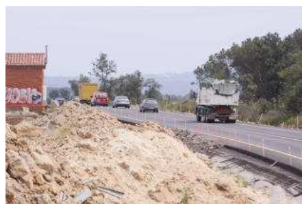
Imatge d'arxiu de la N-II amb les obres paralitzades. marc martí

GIRONA | ROBERT VAN EECKHOUT El missatge és clar. Les obres que s'han de realitzar a la N-II, especialment al tram Sils-Caldes de Malavella, són una prioritat per tots els grups polítics amb representació gironina al futur Congrés dels Diputats. D'una manera o altra, tots van reiterar ahir el compromís del seu grup polític amb la causa. Un "tots a una" (amb matisos) digne només de les grans problemàtiques que afecten el país. En el rerefons, un territori amb una carretera a mig fer que, amb el 2011 escrivint ja les seves últimes pàgines, haurà d'esperar que l'any nou li porti unes obres que fa dos i mig que anhela.