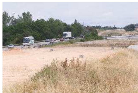
Les obres de la N-II entre Caldes de Malavella i Sils fa més de dos anys i mig que estan aturades. marc martí

L'habilitació de dos carrils entre Caldes de Malavella i Sils per convertir la carretera en una autovia i acabar facilitant la circulació ha acabat significant, en els darrers anys, tot el contrari. L'aturada de les obres al 2009 ha portat durant dos anys i mig tot el trànsit que hauria de suportar la via desdoblada per una carretera alternativa, provocant la indignació de tots els agents del territori.