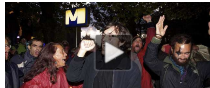
Mig centenar d'indignats, detinguts a Brussel·les per resistir-se a l'autoritat