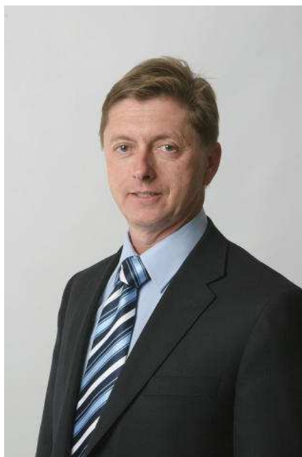
L'alcalde Salvador Balliu.

Un altre punt del ple que es va aprovar és un conveni amb l'associació de propietaris de la urbanització d'Aigües Bones de Caldes. En concret, aquest estableix que l'Ajuntament es fa càrrec de gestionar la construcció d'una pista polivalent a l'àrea residencial amb els diners, segons va explicar l'alcalde, uns 150.000 euros que l'entitat havia destinat inicialment per a un projecte d'urbanització però que segons l'alcalde van acabar "sobrant" i ara es destinaran a construir la pista polivalent.