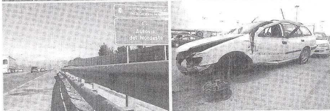
A dalt, els dos cotxes implicats en el xoc de Caldes de Malavella i, a sota, a l'esquerra el punt quilomètric 702 de l'N-II, on es va produir l'accident. Al costat, el Peugeot 406 on anava la víctima de Viladamat.