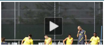
Passió pel Barça a Dallas