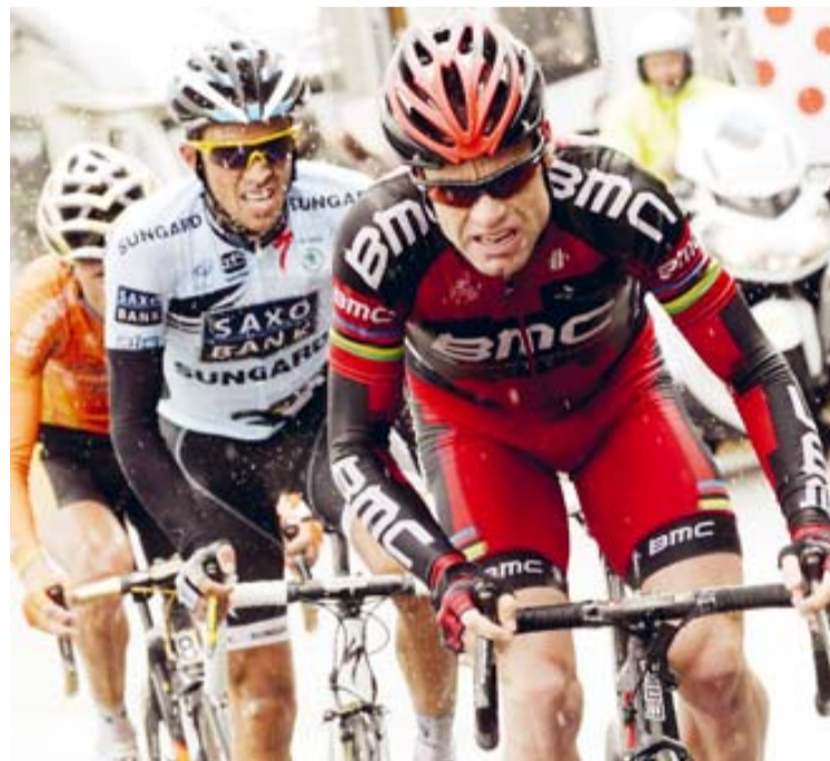
Evans, Contador i Sánchez, en ple esforç.

L'espectacular desenllaç de la jornada situa els cinc grans favorits, amb el permís de Voeckler –Evans, els germans Schleck, Sánchez i Contador– en una diferència de menys de dos minuts abans d'afrontar