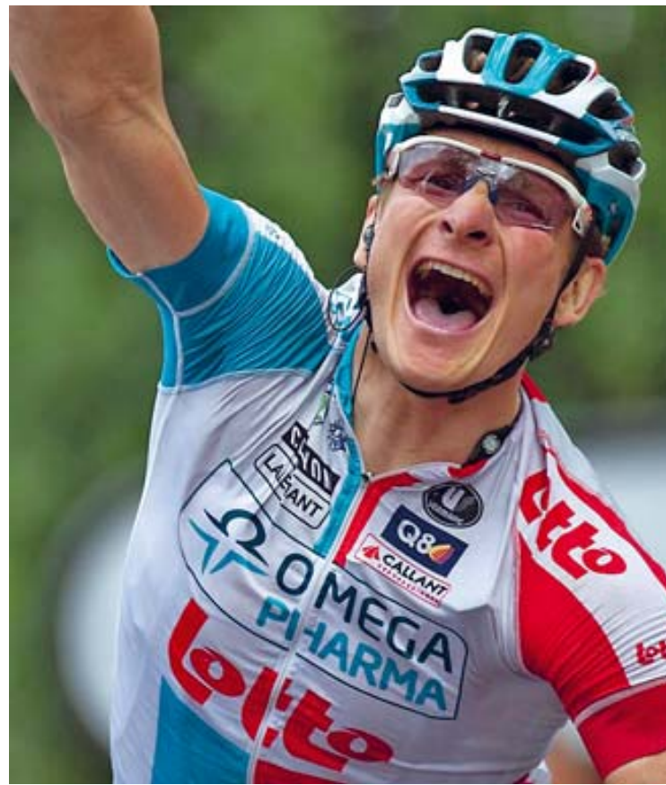
Greipel alça el braç després de batre Cavendish ahir.

posant-se en clàssiques, mentre la glòria se l'emportava Cavendish embutxacant-se etapes del Tour a dojo. Públicament no van fer comèdia. «Ell no és un problema per a mi, sóc millor corredor», va declarar Cavendish respecte al seu company. Greipel no amagava el desig que l'anglès abandonés l'equip, però al final va ser ell qui va canviar d'aires. L'operació permetia que els dos corredors es tornessin a batre en els esprints, sense restriccions. Finalment ahir, el de Rostock va treure la ràbia acumulada adjudicant-se la primera etapa en la volta francesa i després que el seu exequip, l'HTC, hagués treballat durament per atrapar un grup d'escapats i llançar Cavendish. Els dos ciclistes es podrien tornar a enfrontar avui en un recorregut molt similar al de l'etapa d'ahir abans de les tres etapes dels Pirineus.