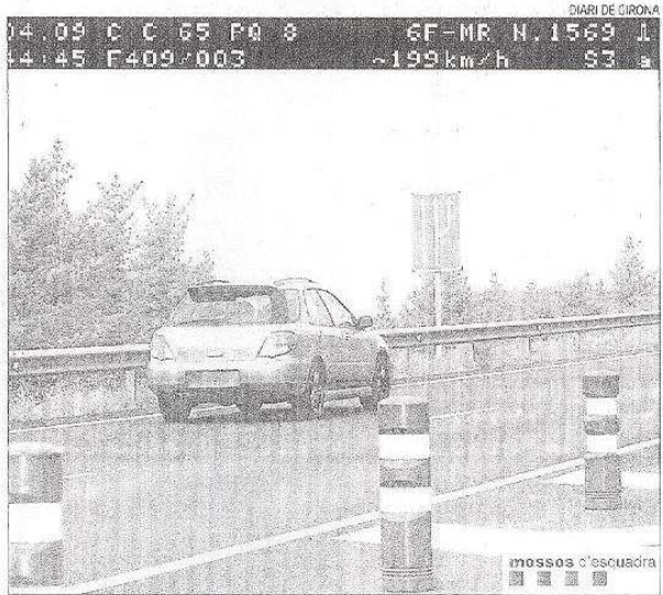
Un cotxe enxampat a 199 km/h a Llagostera, en una imatge d'arxiu.

La Selva és la comarca gironina amb més radars fixos. En total, en té nou en funcionament. Una xifra que s'ampliarà aquest 2011 amb dos nous dispositius ubicats a la C-35 a l'alçada de Caldes de Malavella i a la C-63, a Vidreres. L'Alt Empordà també destaca pel gran nombre de radars fixos repartits per la seva geografia. En total n'hi ha vuit. Aquesta comarca també ampliarà enguany el nombre de