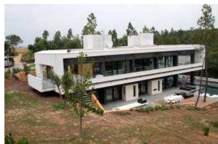
Una de les cases de mostra ja construïdes, que es va inaugurar ahir. No té murs, de manera que està integrada amb l'entorn de vegetació i camps de golf que l'envolten

CALDES DE MALAVELLA | JORDI VERA Viure envoltat d'un entorn idíl·lic entre arbres i forats de golf en un xalet de luxe amb seguretat les 24 hores del dia i a pocs minuts de Girona. Aquest és l'ambiciós projecte que està impulsant el PGA Catalunya de Caldes de Malavella, que invertirà uns 200 milions d'euros en deu anys per construir una urbanització de luxe a l'entorn dels dos camps golf. En total està previst que es construïxin 368 habitatges, entre cases i apartaments, amb uns preus que oscil·laran els 325.000 euros i els dos milions d'euros de sortida. De moment, ja s'han invertit uns 15 milions d'euros amb la construcció de dues cases de mostra, 15 xalets que estaran acabats a partir del setembre i 15 apartaments més, que podrien estar enllestits el juny de l'any que ve.