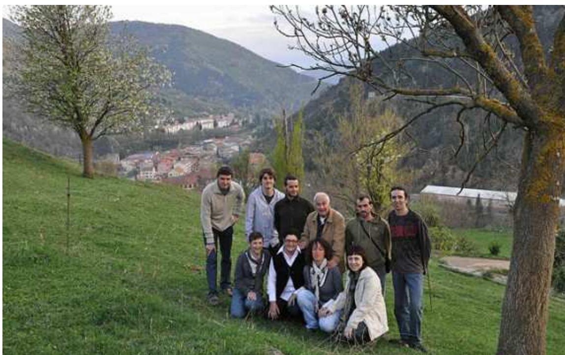
La llista d'ERC Ribes.