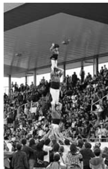
Ambient de gala a Figueres, tot i la derrota.

En plenes Fires i Festes de la Santa Creu de Figueres, la Unió va veure com el Ripollet, màxim rival pel títol, li impedia que la festa fos completa (0-1). Una victòria hauria deixat a tocar el títol de preferent -l'ascens ja és a la butxaca-, però el conjunt del Vallès Occidental va aconseguir la victòria gràcies a un gol en una acció aïllada i ara és el líder per goal average -en la primera volta els vallesans també es van imposar per la mínima (1-0)-. La derrota, però, no va deslluir l'excel-