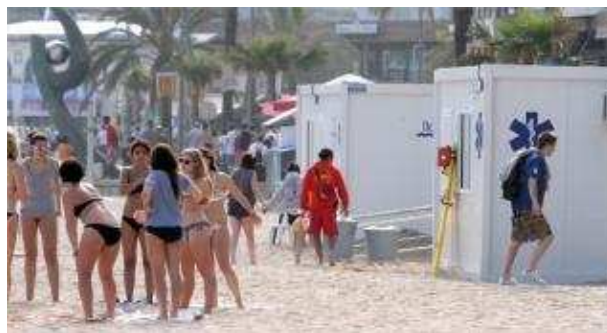
Les platges de Lloret de Mar, molt freqüentades en els dies assolellats de Setmana Santa, sí que estan vigilades per socorristes.

I és que, tot i que la climatologia no ha acompanyat durant els dies centrals de la setmana de vacances, les temperatures a l'Empordà i la Selva s'enfilaran, diu el servei meteorològic de la Generalitat, fins superar generosament els vint graus de màxima entre avui i demà dilluns, darrer dia de festa a Catalunya. I per tant, tant foranis com residents habituals a la Costa