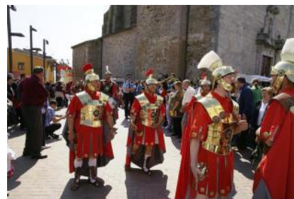
La desfilada dels Manaies va recórrer els carrers del poble. josep m. bartomeu

El Mercat Romà va néixer l'any 2007, com una iniciativa de l'entitat Manaies de Llagostera i l'Ajuntament, per tal de donar un nou impuls a aquesta tradició tan arrelada al municipi.