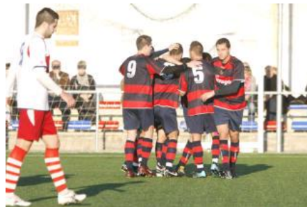
Els jugadors del Llagostera s'abracen després d'un gol d'aquest curs.