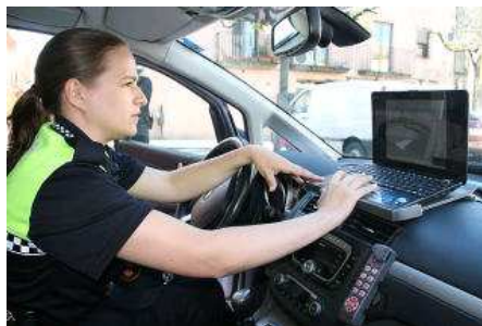
Una de les agents del cos de policia local de Caldes mostrant el nou sistema de consulta de dades.

La Policia Local de Caldes de Malavella ha creat un sistema per consultar dades i agafar denúncies des del cotxe pensat específicament per a municipis petits. El dispositiu es basa en un ordinador portàtil i una connexió a Internet sense fils. Mitjançant un programari ideat pel caporal i un dels agents, la policia pot accedir directament al sistema, consultar-hi dades en temps real i també agafar denúncies.