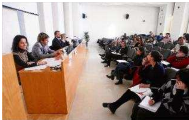
Un moment de la jornada, en la qual es va posar a debat la política d'immigració. marc martí

administracions haurien de destinar més suport econòmic per controlar la immigració a Salt. Així ho va manifestar el reconegut catedràtic en Dret de la Universitat Autònoma Eduardo Rojo, que ahir va ser a Girona en el marc d'unes jornades sobre la reforma de la llei d'estrangeria i la relació entre la immigració i el treball. Rojo va remarcar que la situació de crisi pot haver accentuat els problemes de convivència derivats de les altes taxes d'immigració que hi ha en aquesta localitat gironina.