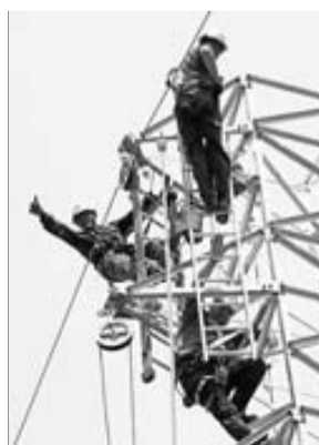
Reparació d'una torre a Castell d'Aro ■ LL. SERRAT

La Generalitat va donar a Endesa fins al 30 de juny com a termini màxim per arreglar tota la xarxa elèctrica gironina. La companyia va complir amb el calendari, i així es va assegurar evitar riscos d'apagades durant la temporada d'estiu. Per si de cas, es van reservar 450 grups electrògens.