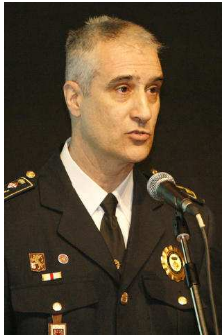
El cap de la policia, Josep Miñarro. aniol resclosa

D'acord amb la factura, dins l'apartat de materials, destaquen els 114,90 euros d'un pilot, els 337,40 de dos pneumàtics, els 124,40 d'un retrovisor, els 105 de dos equips nous de manguins o els 52,55 de l'oli del motor. També hi ha líquid refrigerant i líquid rentaparabrisas, un joc de catifetes, un filtre d'oli, un altre d'aire i un tercer de combustible. Quant a la mà d'obra, queda palès que es va canviar l'oli, els filtres d'oli, aire i combustible. La despesa més important en aquest àmbit són els 189 euros per substituir els dos manguins de dues transmissions.