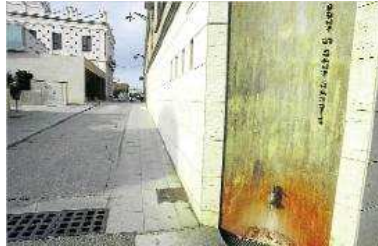
Una de les fonts d'aigua calenta que es troben al centre de Caldes.

Pel que fa als motius d'aquesta baixada del cabal de l'aigua termal, tot indica que el desplaçament dels canals naturals dels aqüífers és el que hauria provocat la baixada del cabal i des de Mines es destaca que sempre s'ha estat optimista perquè els dies posteriors al terratrèmol les anàlisis van detectar que hi havia molt diòxid de carboni (CO2) concentrat al subsòl i això provocava molta pressió i, en conseqüència, que l'aigua busqués una sortida, un punt a favor de Caldes ja que això, asseguren, indicava que els cabals es recuperarien. D'altra banda, des d'aquest ens remarquem que la documentació de més de 20 anys d'aquest jaciment termal els va tranquil·litzar perquè en d'altres episodis sísmics, esperant un cert temps, es va veure que els brolladors tornaven al seu cabal.