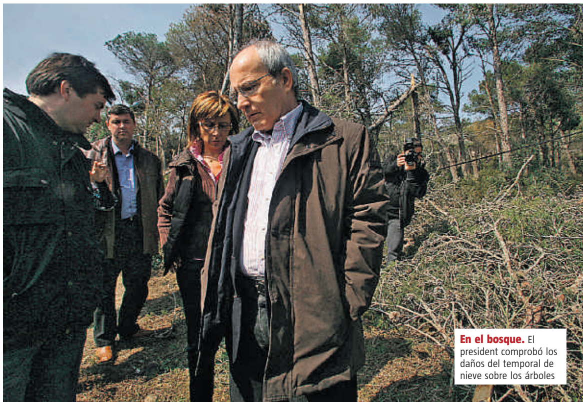
En el bosque. El president comprobó los daños del temporal de nieve sobre los árboles