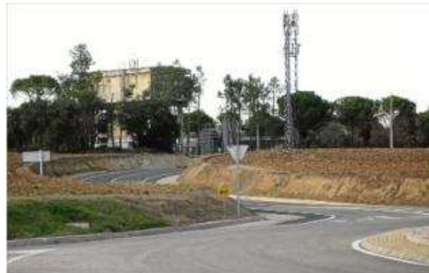
La zona on es preveu alçar aquesta nova ronda per a l'exterior del nucli de Caldes de Malavella. caldes de malavella

Tot i que encara no hi ha cap projecte redactat ni estudi previ; la previsió de Caldes en el seu nou POUM és que la nova carretera, que com tota variant va per l'exterior de la població així evita el trànsit pel centre, hauria de transcórrer des de l'alçada dels terrenys de Repsol -la sortida de la Nacional II- i anar a finalitzar el seu recorregut a l'entorn del dipòsit municipal d'aigua potable de Caldes, a tocar la carretera que uneix el municipi amb el de Cassà de la Selva, la GI-6741. Un traçat que pot variar segons s'acabi redactant per part dels tècnics del Departament de Territori i Sostenibilitat i de la disponibilitat pressupostària en temps de