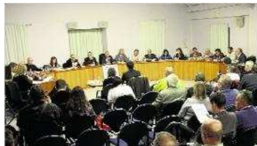
Governació va atorgar 8.000 euros dels 20.000 previstos. diari de girona

L'Ajuntament va sol·licitar, l'abril de l'any passat, al Departament de Governació una subvenció de 20.000 euros per desenvolupar un projecte per formar empresaris. En concret era un Curs intensiu de comerç electrònic dirigit al comerç i l'empresariat. En un primer moment, doncs, el cost total del projecte s'havia calculat en uns 25.000 euros, dels quals l'Ajuntament n'havia de posar el 20%, és a dir, 5.000 euros, i la Generalitat, la resta. A finals del mes de setembre, Governació va resoldre que per al projecte aportaria la quantitat de 8.316,88 euros. Motiu pel qual el govern local va decidir finalment aquest desembre rebutjar la realització del curs i, per tant, els 8.000 euros de subvenció. El motiu principal era que la subvenció era insuficient. De fet, així ho especifica en la Junta de Govern: "L'Ajuntament no pot executar el projecte en les condicions que l'atorgant ha