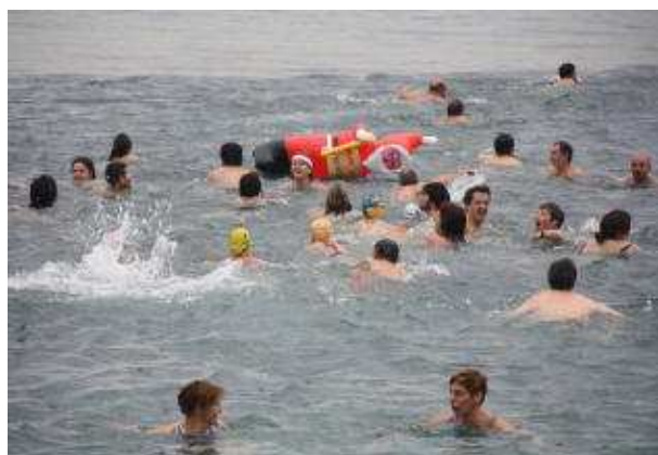
Alguns dels banyistes que van desafiar la fred a Sant Feliu.