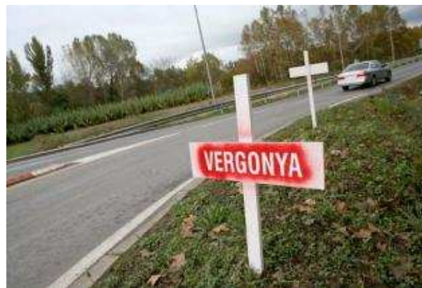
L'actual N-141 és coneguda com la carretera de la Vergonya.

Tot i això, fonts del PTOp asseguren que no hi ha cap decisió presa, sinó que es tracta d'una previsió, que haurà de comptar amb el consens del territori ja que hi ha diferents posicions envers quina sortida de l'AP-7 hauria d'anar a enllaçar. De fet, la connexió de la N-141 amb la nova sortida de l'AP-7 a Sant Gregori compta amb l'oposició d'aquest municipi, així com de grups ecologistes perquè des del seu Ajuntament no volien que la carretera transcorregués per diferents parts del