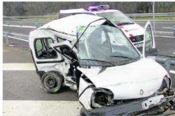
La furgoneta Renault Kangoo poca estona després de la topada.