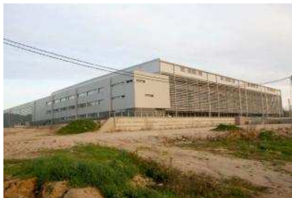
La Ciutat Esportiva queda fora de la trama urbana consolidada. carles colomer

La zona comercial, però, encara no està del tot descartada. En el mateix informe, Comerç especifica que es "permet excepcionalment implantacions de grans establiments comercials fora de la trama consolidada, però en continuïtat física immediata". La idoneïtat, però, s'estudiarà cas a cas un cop sol·licitada la llicència comercial,