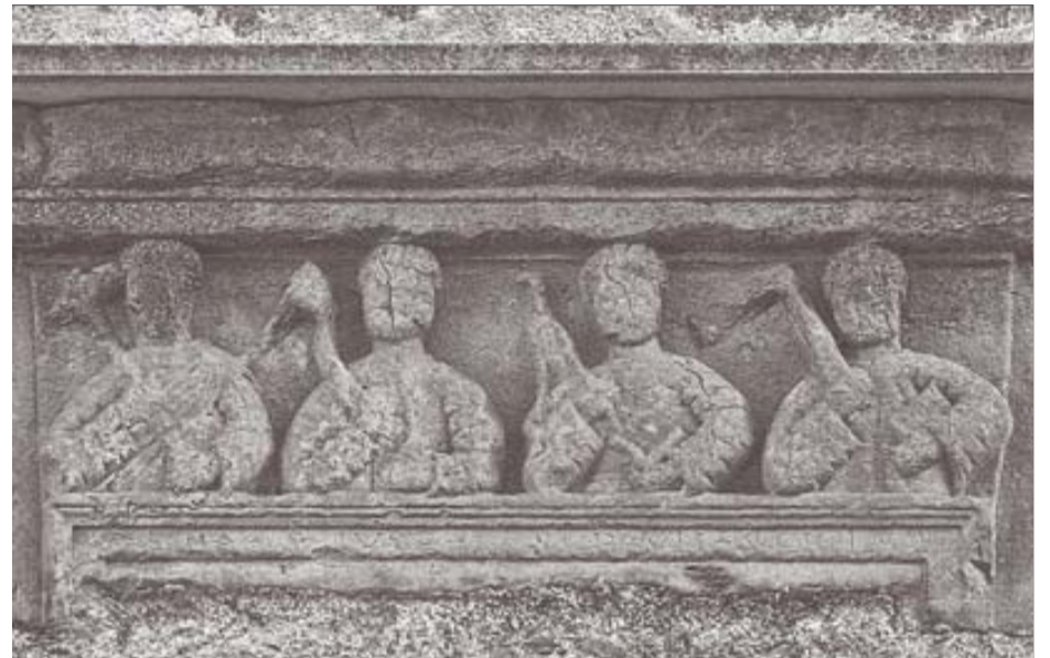
Germà, Just, Paulí i Scisci, els quatre patrons màrtirs dels picapedrers, a l'església de Corçà