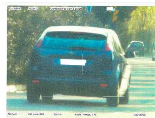
Un vehicle enxampat circulant a 100 km/h a l'avinguda de França, ajuntament de sarrià

TAPI CARRERAS La policia local de Sarrià de Ter ha fet diversos controls durant els primers dies de desembre en diversos punts del municipi i ha detectat multitud d'infraccions en el límit de la velocitat. Majoritàriament s'ha detectat excés de velocitat a l'avinguda de França (l'autovia). En només dues hores, en un control efectuat en aquest punt el 2 de desembre a primera hora de la tarda, es van enxampar 200 vehicles que superaven la velocitat màxima permesa, que en aquesta carretera és de 50 km/hora. Alguns dels cotxes doblaven la velocitat i van ser fotografiats a 100 km/h.