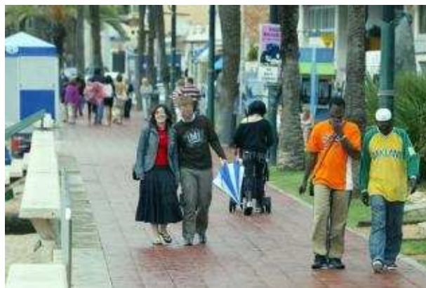
La diversitat de procedència dels habitants censats a Lloret de Mar es fa palesa al carrer

Les dades del padró d'habitants que actualitza l'Ajuntament de Lloret mes a mes demostren també que, en només dos mesos, la població d'aquest municipi costanar s'ha incrementat en 1.000 persones. En concret, s'ha pasat dels 39.866 habitants de l'octubre de 2010 als actuals 40.887. Un fort increment perquè si es miren dades de fa més d'un any enrere, per exemple el maig de 2009, Lloret tenia 38.805 habitants, fet que representa 2.000 persones menys censades que en l'actualitat. Pel que fa a les