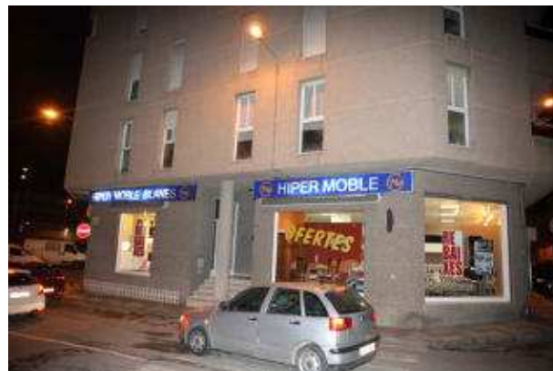
L'immoble on vivia el llogater al carrer Treumal de Blanes. carles colomer

El processat, que té 31 anys, vivia en un pis de lloguer situat al carrer Treumal. El jove havia de pagar 450 euros mensualment, però -segons sostenen les acusacions- tenia deutes amb el propietari per haver-se endarrerit en els pagaments. Deute que l'acusació particular xifra en 4.000 euros, mentre que el fiscal s'absté en fer concrecions.