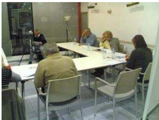
Els estudis de l'emissora de ràdio municipal de Blanes, en una imatge d'arxiu.

En una primera sentència del Jutjat Mercantil 1 de