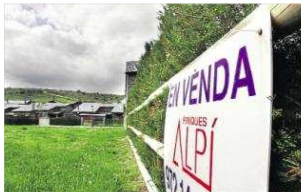
Comarques i municipis amb molt habitatge de segona residència són els que més tardaran a reduir l'estoc acn

GIRONA | O.P. / ACN La reducció de l'estoc d'habitatges a Girona i a Salt ha fet pujar els preus dels pisos nous per primer cop des de l'inici de la crisi. Segons recull el darrer estudi elaborat pel Gremi de Promotors i els API, també hi ha hagut increments de preus en altres ciutats on la gent aposta per fixar-hi la primera residència, com ara Banyoles o Santa Coloma de Farners. El sector continua insistint que, malgrat que hi ha zones de costa i de muntanya on encara s'acumulen molts pisos nous sense vendre, cal desbloquejar el finançament per permetre edificar als llocs on hi ha demanda. D'altra banda, l'entrada d'habitatges nous que no tenien sortida al mercat de lloguer n'ha fet baixar els preus.