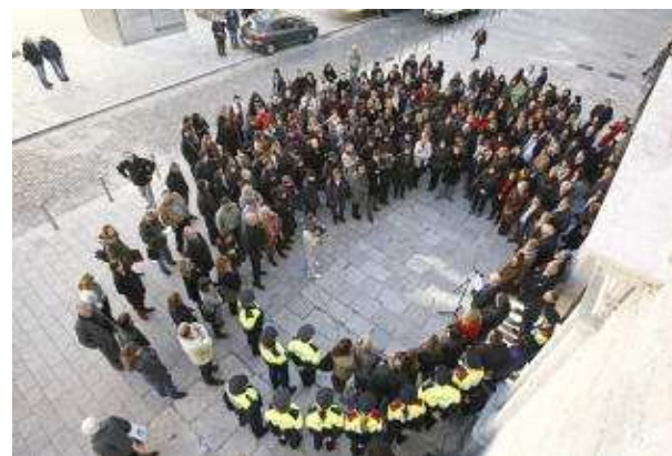
L'acte de rebuig contra la violència de gènere davant la seu de la Generalitat a Girona. aniol resclosa

Des del Servei Integral d'Atenció a la Violència de Salt s'han atès a 73 dones donada la seva situació de violència masclista. Mentre que des dels Serveis Bàsics d'Atenció Social del Gironès s'han detectat 67 casos violents més. A més, des del gener de 2010, el Servei d'Informació i Atenció a les Dones del