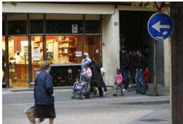
Immigrants legals critiquen els il·legals perquè els perjudiquen a tots. aniol resclosa

Passejant pel centre del municipi sembla que la campanya electoral no hi ha arribat. Gairebé no hi ha cartells electorals i els comerciants i veïns asseguren que els polítics no s'hi han acostat. De tota manera, es mostren molt desencantats amb els actuals representants, malgrat que la majoria anirà a votar diumenge. Com a elements prioritaris per al nou Govern marquen la immigració i la regulació i compliment dels horaris comercials.