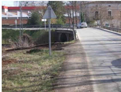
L'estat actual del pont del Salt.