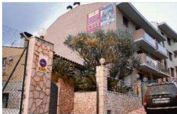
El bloc es troba a tocar la casa de la demandant que va guanyar el primer judici i ara també se li dona la raó.