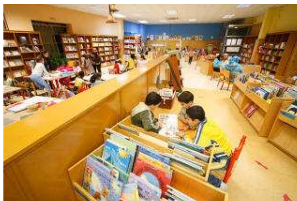
La biblioteca Massagan ha estat distingida per promoure la integració. marc martí

El Grup de Recerca lamenta que s'exigeixin sis mesos d'empadronament com a "conditio sine qua non" per tramitar i fer l'informe d'arrelament. L'alcaldeessa recorda que aquest és el mínim que habitualment es demana a molts altres ajuntaments a