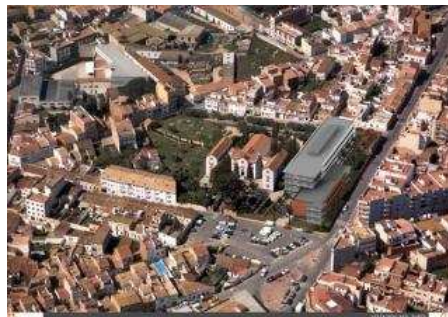
Imatge virtual de com quedarà el projecte d'ampliació. ddg

L'ampliació preveu la construcció d'un edifici modern adjacent a l'actual, amb quatre plantes en superfície i dues subterrànies. Es preveu eliminar l'afegit més recent que hi ha actualment a la part de darrere de l'asil, i respecta l'edifici originari del 1898. L'ampliació comprèn 9.000 metres quadrats i el jardí dobla la capacitat actual, arribant als 7.000 metres. Amb el projecte es preveuen cobrir les necessitats assistencials que pot tenir la ciutat els anys 2025-2030. L'inici de les obres pot ser entre 2014 i 2015.