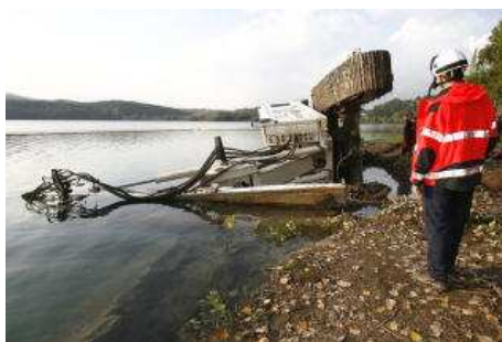
La màquina pesa cap a 50 tones aniol resclosa

E. PADILLA Una retroexcavadora giratòria que treballava en la refeta dels murs de la zona de banys de l'estany de Banyoles va bolcar i va causar una petita fuga de fuel que es va estendre per la riba però que no va afectar-ne el fons, va explicar el regidor de Seguretat Ciutadana, Lluís Costabella. L'accident va tenir lloc passats dos quarts de dues de la tarda, segons els Bombers. El conductor de la màquina va poder saltar i evitar així conseqüències greus, ja que la màquina va quedar parcialment submergida a tocar de la riba, en un lloc on hi ha una profunditat d'un metre d'aigua.