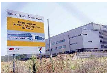
La nova trama urbana consolidada, que inclou la Ciutat Esportiva, es va aprovar dilluns passat. diari de girona

La Generalitat de Catalunya té la darrera paraula sobre la futura zona comercial que Blanes vol construir al voltant de la nova Ciutat Esportiva de la localitat, després que l'Ajuntament hagi aprovat definitivament aquesta zona com a "trama urbana consolidada". El ple municipal va arribar a aquest acord, per unanimitat, dilluns passat, després que els serveis tècnics hagin resolt les diverses al·legacions presentades, després de la primera aprovació. Cal recordar que el consistori va desencallar aquesta qüestió el passat mes de juny en aprovar inicialment aquesta nova trama. A través d'aquest acord, doncs, l'Ajuntament declara com a zona de trama urbana consolidada aquest espai d'uns 2.000 metres quadrats que hi ha a tocar aquest equipament esportiu. Tot aquest procés s'ha de tirar endavant perquè la Generalitat no permet que hi hagi grans superfícies comercials fora dels nuclis de població, i per això demana aquestes modificacions, per no perjudicar el comerç de l'interior dels pobles.