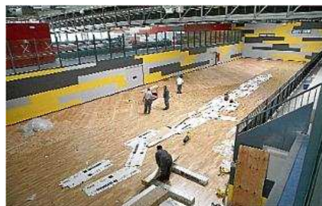
Les pistes de la Ciutat Esportiva mentre s'hi estava posant el parquet durant una vista l'abril de l'any passat.

La ciutat esportiva de Blanes ha estat immersa de polèmica des del primer dia; si els treballs es van iniciar el 2003, ara fins al 2010 no s'acabaran, després que durant dos anys estiguessin aturats. A més, els terminis per a la seva obertura sempre s'han acabat postposant perquè es va dir fa tres anys que estarien i també en fa dos, però sembla ser, que serà ara en plena tardor que aquesta ciutat esportiva començarà a rodar. També s'ha de convertir en un referent del turisme esportiu a Girona.